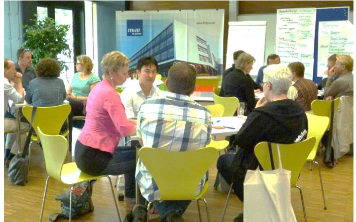
Workshop des Klient*innen-Beirats

Zum Klient*innen-Beirat werden Klient*innen eingeladen. Klient*innen sind Menschen, die von Sozialarbeiter*innen beraten und begleitet werden. Die Klient*innen werden eingeladen, über ihre Erfahrungen mit Sozialarbeitern und Sozialarbeiterinnen zu diskutieren. Sie reden kritisch über die Erfahrungen, die sie gemacht haben. Was ist gut gelaufen? Und warum? Was ist schlecht gelaufen? Und warum? Was müssen Sozialarbeiter*innen lernen, damit es gut läuft. Was muss geändert werden, damit es besser läuft?